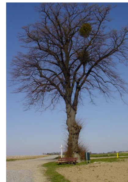
Lindeboom met maretak

Maretak, vogellijm of mistletoe zijn drie benamingen voor een gaffelvormige, altijd groene en vaak bijna ronde struik, die woekert op allerlei loofhoutgewassen, vooral op populieren, appel en lindebomen, berken, hazelaar, peer, kers en maar zelden op eiken.