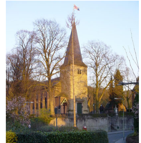
kerk van Bemelen

Even verderop ligt in de glooiende weide de Beusdalhof.