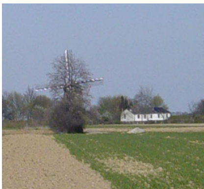
'Van Tienhoven molen'

rechts en komen spoedig op een verkeersweg. Hier gaan we naar rechts en komen bij de eerste huizen van Klein Welsden. Links voor ons zien we een groot gebouw met 4 witte silo's. Vóór dit gebouw gaan we naar links en lopen in de richting van de Van Tienhoven molen, die we in de verte zien.