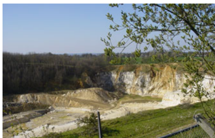
groeve 't Rooth

Na enige tijd komen we in het gehucht 't Rooth dat we in de lengte passeren. Aan het einde van de straat staat links een kapel.