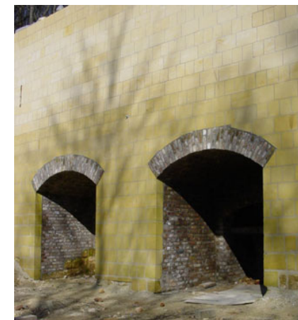
oude kalkovens in restauratie

Als we bijna beneden zijn zien we aan de linkerkant de ingang van een oude ondergrondse mergelgroeve, de 'Rothergroeve'. De ingang is door een zwaar ijzeren hekwerk afgesloten, zodat geen ongenode gasten deze groeve betreden. Wel is er voldoende speling gelaten zodat de vleermuizen ongestoord in en uit kunnen vliegen. Even verder komen we op een geasfalteerde weg. Dit is weer de verbindingsweg van Maastricht naar de Nekami groeve. Rechts in het talud bevinden zich oude kalkovens. In 2002 is men met de restauratie van de erg onderkomen ovens begonnen. We gaan hier naar rechts en na ongeveer 150 meter komen we weer bij het kruispunt waar we bij het begin van onze tocht van het bospad zijn gekomen. Hier